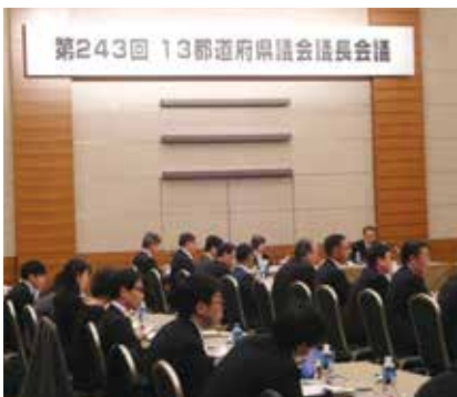
11月12日 13都道府県議会議長会議にて各都道府県から提出された議案等について審議が行われました。