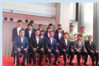
7月9日 ひょうごプレミアム 芸術オープニングイベントで 和太鼓やスーパーキッズ オーケストラによる演奏が 行われ盛大に開幕。