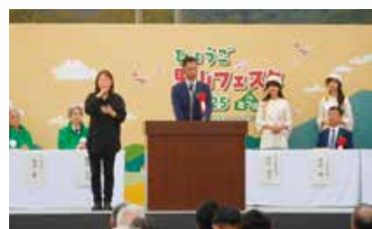
10月12日 ひょうご里山フェスタ2025 in たつの 今年はたつの市で開催。 多くの来場者で賑わっていました。