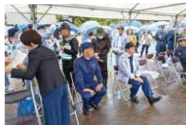
11月9日 兵庫県・播磨広域合同防災訓練にて 地域の安全と安心にご尽力いただき 心から敬意を表します。