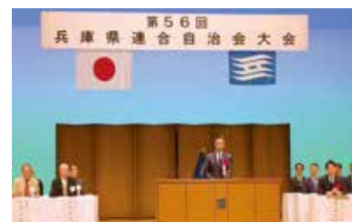
11月28日 兵庫県連合自治会大会 明るく住み良い地域づくりにご貢献いた だいた方々への自治賞等が授与されました。 日頃の活動に感謝申し上げます。