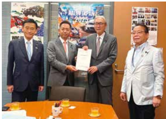
7月22日 各会議や要望会

ディに実行していきます。高齢世代から現役世代、そして将来を担う世代、全ての世代に対する責任、防災・減災対策の強化、次世代産業・地場産業の育成など、ひょうご五国の多様性を活かしながら、安全・安心で活力あふれる地域づくりを加速していくことが必要です。