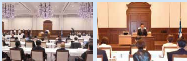
6月12日 第128代兵庫県議会議員に選出されました