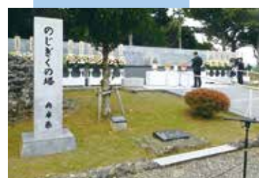
11月21日 のじぎくの塔慰霊祭・島守の塔慰霊祭にて 戦後80年。平和への決意。 犠牲となられた方々へ、謹んで哀悼の意を捧げました。