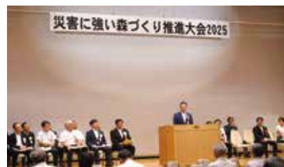
9月7日 災害に強い森づくり推進大会2025

国内各地で山地災害や 風水害が多発・甚大化 しているためさらなる 推進に向け開催。