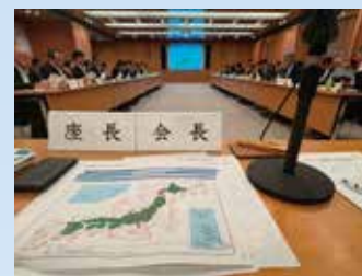
7月22日 各会議や要望会 全国議会へ出席。 座長としてデビューしました。