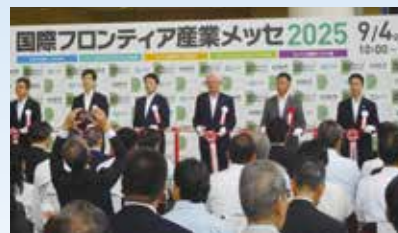
9月4日 国際フロンティア産業メッセ2025 西日本最大級の産業総合展示会「国際 フロンティアメッセ2025」の除幕式にて (地元からも多くの企業が参加)