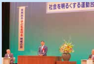
7月6日 社会を明るくする運動合同研修会 支え合い、励まし合う心を育む、 明るい社会づくりを誓う。