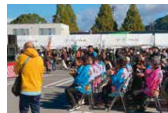
11月3日 たつの市民まつり

快晴の中盛大に開催されました。 いろんなお店やパレードなど、たくさんの 人にお会いできた楽しい1日でした。 午後からは「太子あすかふるさとまつり」へ