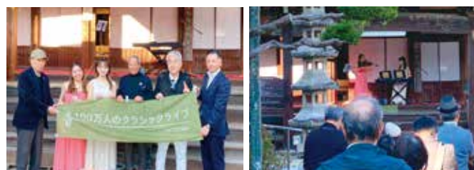
11月23日 100万人のクラシックコンサート in 如来寺 「クラシックをもっと身近に」と全国的に活動されています。 多くの方でオータムフェスタも賑わっていました。