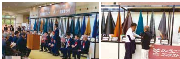
11月15日 ひょうご皮革総合フェア2025&たつの市皮革まつり 地域の産業振興と伝統技術の継承にご尽力されている関係者の 皆様に敬意を表しますとともに毎年楽しみな行事です。