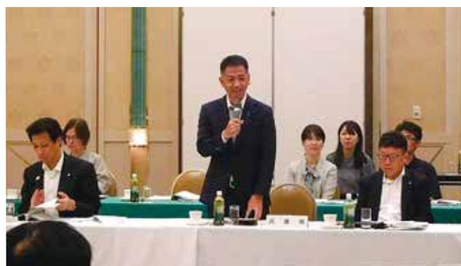
8月7日 近畿2府8県議長会会議にて兵庫県を代表して意見を提出

今年の干支は「丙午（ひのえうま）」です。「情熱と行動力で前に進む、燃え盛るようなエネルギーで道を切り開く」といった含意の年とされています。二元