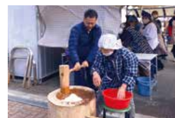
12月14日 小宅コミセンまつり 世代を超えての交流が行われてい ました。私も餅つきをさせてもらい、 寒い日でしたが汗をかきました(笑)