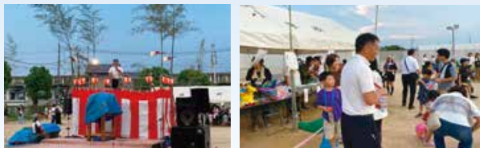
8月16日 揖保地区ふれあい納涼盆踊り大会