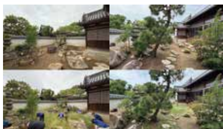
9月14日 月1回の掃除に学ぶ会(斑鳩寺) 「斑鳩寺」と「たつの市役所周辺」を 隔月で取り組んでいます。