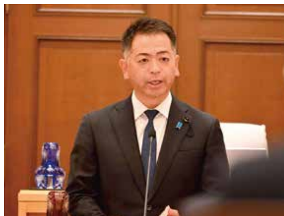
6月12日 第128代兵庫県議会議長に選出

昨年は阪神・淡路大震災から30年の節目を迎え、改めて命と暮らしを守る防災・減災の重要性を再確認した年